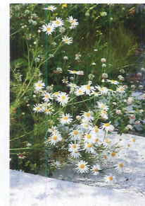
NÄRA NATUREN. Betongtrappan med prästkragar och klöverblomster.

»Vi anlidade YAJ arkitekter som skapade en spännande, modernistisk souterrängvilla i platsguten betong med stora glaspor och trädetaljer i furu.»