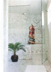
MARMORKLÄTT. I badrummet på entréplanet har familjen även byggt en ångbastu.