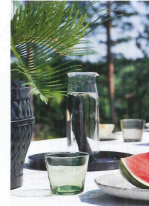
TERRASSEN. På bordet glas och karaff från Alessi.