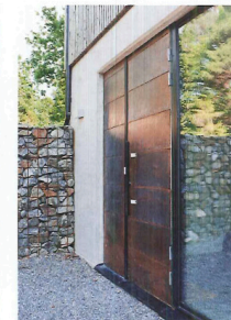
I SOUTERRÅNGPLAN Entrédörren till huset är klädd med koppar. Till vänster en stenfylld avskiljare.