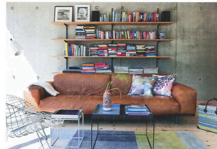
UTSIKTSPLATS. Från soffan i det nedre vardagsrummet har man utsikt över den japaninspirerade trädgården, liksom över gästhuset i betong med Sedumtak bestående av tåliga växter.