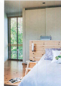
LJUSTRÄ. Sänggaveln ritade arkitekten in som en avskiljare, bakom finns stora garderober.